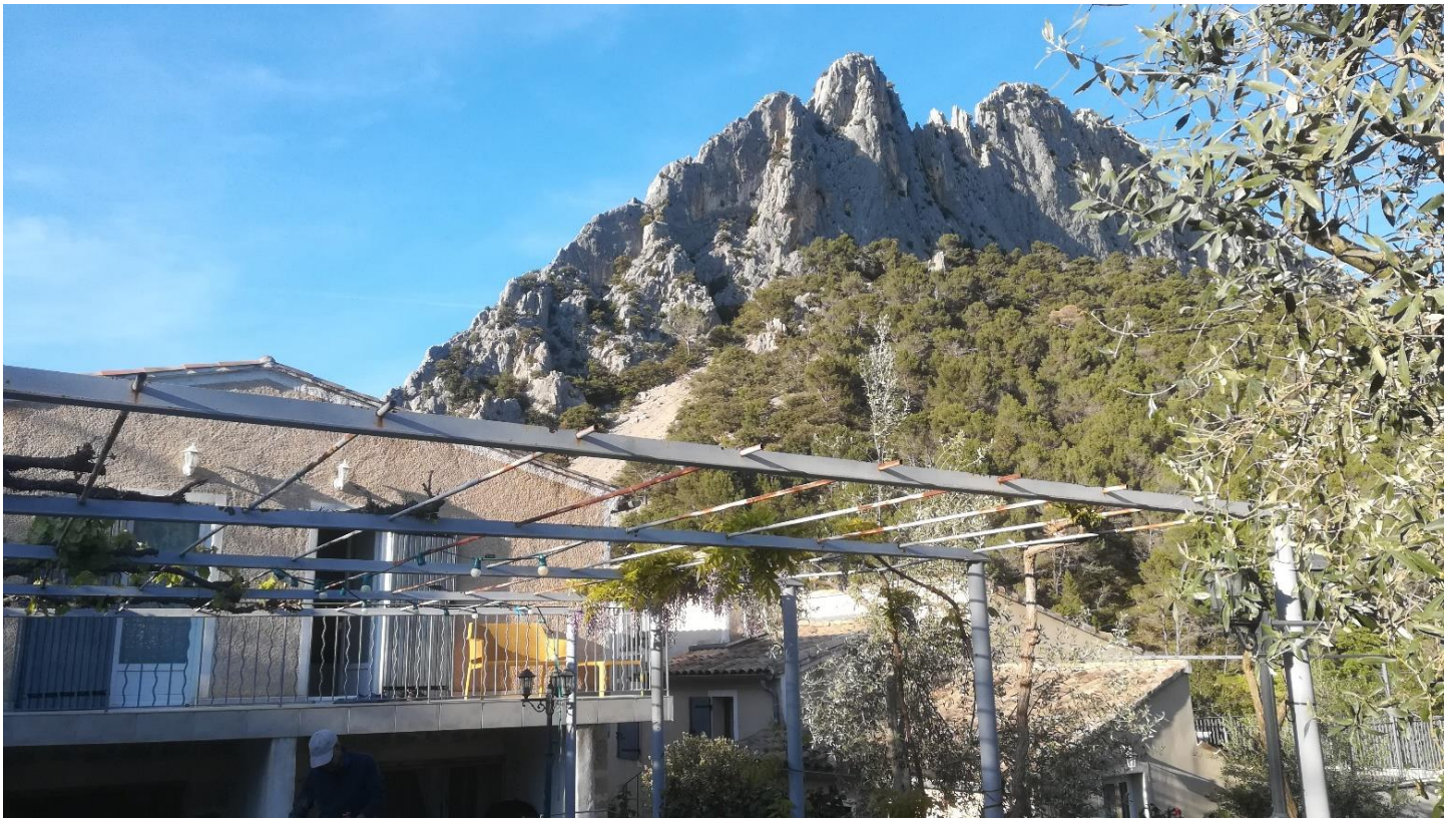
Vue sur Le St Julien depuis notre gîte et terrasse