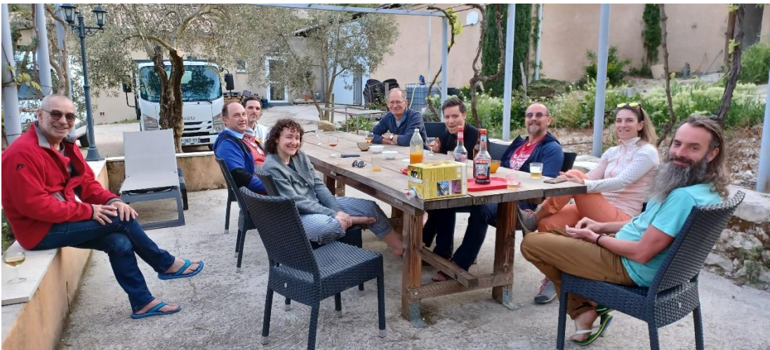
Petit apéro du soir

Encore un super séjour : du beau temps, une belle équipe avec des jeunes (un peu), des vieux (beaucoup), de la mixité, des belles voies et des bons produits locaux. Vivement le prochain séjour !