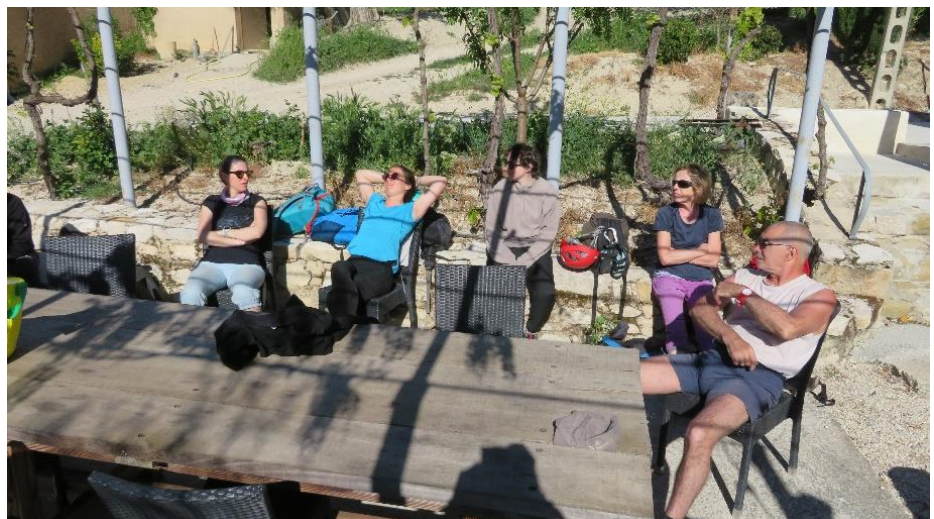
Départ du matin